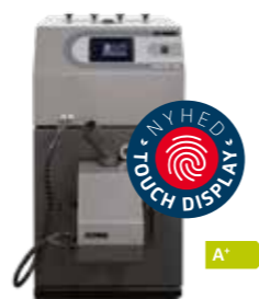
Pellux 100 Touch pillefyr 20/30 kW