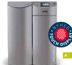
Pellux Compact Touch pillekedel