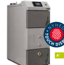
Vedex 4000 forbrændselskedel