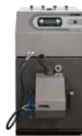
Pellux 100 pillefyr 20/30 kW

Vores sortiment rummer nogle af markedets mest moderne og energieffektive pillefyr, både til en-familieshuse, landbrug og erhvervsbygninger.