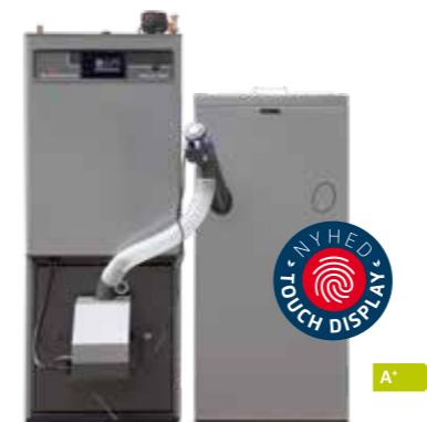
Pellux 200 Touch pillefyr 6-20 kW