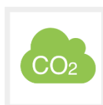
Saving of CO2