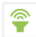
Up to 30%